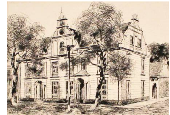
Jochen Donath, „Rathaus Fürstenberg“, Grafik