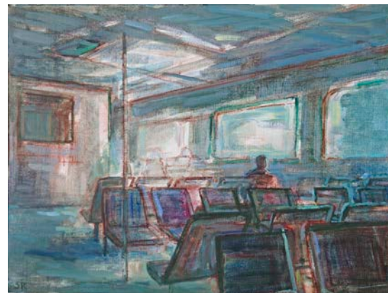
„Überfahrt II (Tristan)“, (zu R. Wagner „Tristan und Isolde“), Öl/Karton, 2023