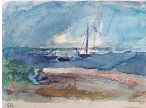
„Ausblick (Hiddensee)“, Aquarell, 2023 (Skizzenbuch)

Werke in privaten Sammlungen in Deutschland, Großbritannien und der Schweiz