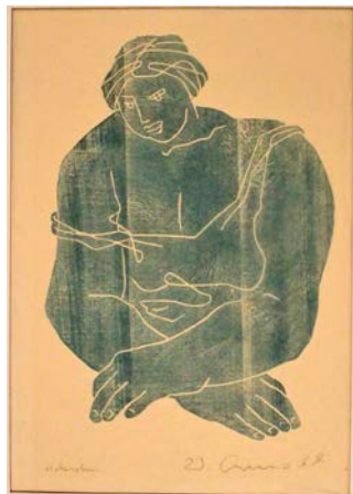
Walter Arnold, „Am Fenster“, Holzschnitt

I. und 3. Samstag im Monat 13.00 - 17.00 Uhr