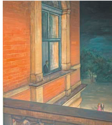
„Pausenende (Bayreuth II)“, Mischtechnik/LW, 2013