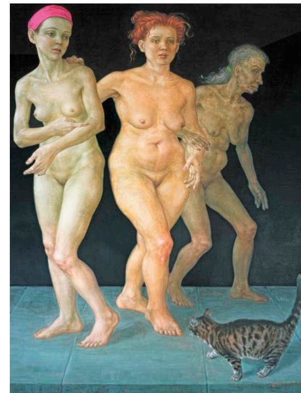
„Biographien II“, Mischtechnik/LW, 2006